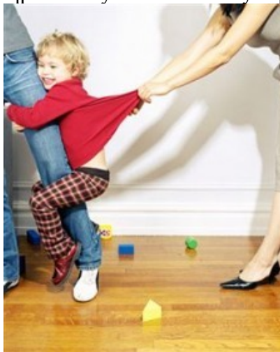
Dítě s aktivovanou dyadickou vazbou

file:///home/jerom/qprednasky/rodina/obrazky/separacni_reakce.jpg